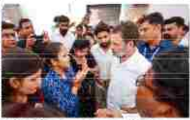
पहलगाम आतंकी हमले में मारे गए लोगों के परिचारों के साथ कांग्रेस सांसद

नई दिल्ली। लोकसभा में विपक्ष का दर्जा दिए जाने की उनकी मांग कानपुर में पहलगाम हमले के पीठ के परिचार के सदस्यों से मुलाकात की और कहा कि वे मृतक के लिए शहीद का दर्जा चाहते हैं। कांग्रेस नेता ने बुधवार को संघटनदाताओं से कहा, मैंने कानपुर में एक पीठ के परिचार से बात की और मृतकों को शहीद के रूप में आधिकारिक मान्यता देने का समर्थन किया। गांधी ने एक्स पर लिखा कि मैं पहलगाम हमले में मारे गए लोगों के परिचारों के दुःख और उन्हें शहीद के साथ छुड़ा हूँ। प्रधानमंत्री से अनुरोध है कि इस आसटी में जान गंवाने वालों के परिचारों की मांगों का सम्मान करते हुए उन्हें यह सम्मान दे। इससे पहले बुधवार को रायबरेली से कांग्रेस सांसद ने