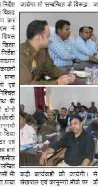
डीएम व एसपी ने तहसील समाधान दिवस का कार्यक्रम में सुनीं फरियादियों की समस्याएं

जायेगा तो सम्बन्धित के विकल्प जाकर शिकायत के निस्तारण की प्रक्रिया की जाएगी। से पूर्व निरीक्षण कर उसके बाद लेखपाल एवं कानूनगो मौके पर