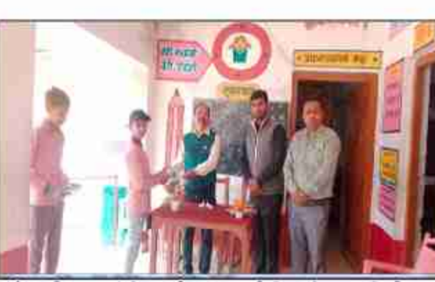
राष्ट्रीय आय एवं योग्यता परीक्षा में जनपद में तीसरा रैंक लाकर विद्यालय का मान बढ़ाया था