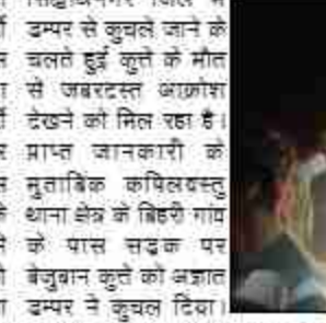
डम्पर से कुचलकर हो रही कुत्तों की मौत, ग्रामीणों में आक्रोश भय का माहौल

दैनिक बुद्ध का संदेश कपिलवस्तु/सिद्धार्थनगर।