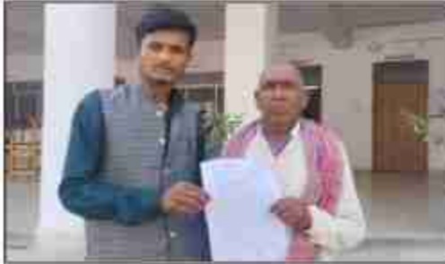
वहाँ डाक्टरों ने आंख का आपरेशन किया और मरीज को 24 जनवरी को छुटी दे दी। घर पहुंचने पर आंख की परेशानी और बढ़ गई। 27 जनवरी को पुनः बस्ती संतकबीर आई हॉस्पिटल लेकर आये। उस दिन हॉस्पिटल के लोगों ने दवाइयों का पत्रका और जांच रिपोर्ट सब ले लिया और सोनीली वाले बस

से आये। वहाँ डाक्टरों ने आंख का आपरेशन किया और मरीज को 24 जनवरी को छुटी दे दी। घर पहुंचने पर आंख की परेशानी और बढ़ गई। 27 जनवरी को पुनः बस्ती संतकबीर आई हॉस्पिटल लेकर आये। उस दिन हॉस्पिटल के लोगों ने दवाइयों का पत्रका और जांच रिपोर्ट सब ले लिया और सोनीली वाले बस घर बैठकर मेरहवा जाकर आंख दिखाने की सलाह दिया। वहाँ सुम्बिनी आई इन्स्टीट्यूट एण्ड रिसर्च सेंटर श्री नाना अम्बिका शाह आई हॉस्पिटल के डाक्टरों ने कहा इन्फेक्शन फैल चुका है, आंख नहीं निकाली मजबूती तो कैसे होने का खतरा है। मजबूर होकर आंख निकलवानी पड़ी। वापस पुनः 07 फरवरी को संतकबीर