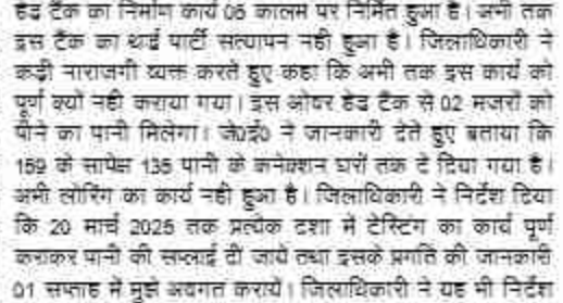
अवगत कराया गया कि यह प्रोजेक्ट वर्ष 2018 में स्वीट हुआ है। इसके निर्माण कार्य की धनराशि वर्ष 2023 में प्राप्त हुई है। ओवर हेड टैंक का निर्माण कार्य 06 कालम पर निर्मित हुआ है। जमी तक इस टैंक का थर्ड पार्टी सत्यापन नहीं हुआ है। जिलाधिकारी ने कड़ी नाराजगी व्यक्त करते हुए कहा कि अभी तक इस कार्य को पूर्ण क्यों नहीं कराया गया। इस ओवर हेड टैंक से 02 मजदूरों को पीने का पानी मिलेगा। जे०ई० ने जानकारी देते हुए बताया कि 159 की सापेक्ष 135 पानी के कनेक्शन धरों तक दे दिया गया है। अभी लॉरिंग का कार्य नहीं हुआ है। जिलाधिकारी ने निर्देश दिया कि 20 मार्च 2025 तक प्रत्येक दशा में टैरिफिंग का कार्य पूर्ण कराकर पानी की सप्लाई दी जाये तथा इसके प्रगति की जानकारी 01 सप्ताह में मुझे अवगत कराये। जिलाधिकारी ने यह भी निर्देश दिया कि यदि ठेकेदार द्वारा पुनः कार्य में लापरवाही बरती गई तो उनके विरुद्ध एफआईआर दर्ज कराने का निर्देश दिया। जिलाधिकारी ने निर्देश दिया कि कमेटी गठित कराकर निर्माण कार्य की जांच एक सप्ताह में पूर्ण करा लें।