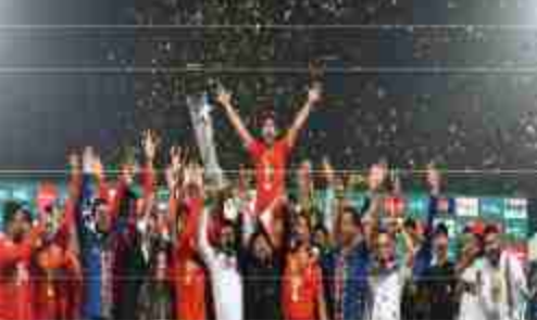
एलिमिनेटर-2 क्रमशः 13 मई 14 मई और 16 मई को खेला जाएगा। इससे पहले सुपर स्टेज में कुल 30 मुकाबले होंगे। लाहौर के गराफी स्टेडियम में 18 मई को फाइनल खेला जाएगा। इसके अलावा रावलपिंडी क्रिकेट