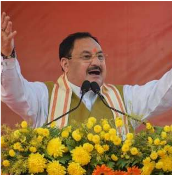
अपना रही है।

भारतीय जनता पार्टी के राष्ट्रीय अध्यक्ष जेपी नड्डा ने अपने कार्यकाल का विस्तार होने के छह महीने बाद अपने संगठन का ऐलान किया। उन्होंने संगठन में ज्यादा बदलाव नहीं किए। ज्यादातर पदाधिकारियों को उन्होंने बनाए रखा है। थोड़े से नए चेहरे संगठन में शामिल किए गए हैं। उनके 38 लोगों के संगठन को देख कर लग रहा है कि जिस तरह नरेंद्र मोदी की सरकार में पिछड़े, दलित और आदिवासी को महत्व दिया गया है वैसे ही नड्डा के संगठन में भी है। यह एक तरह से भाजपा की राजनीति में हो रहे स्थायी बदलाव का संकेत है। ध्यान रहे कुछ समय पहले तक कहा जा रहा था कि भाजपा ब्राह्मणों और बनियों की पार्टी है। लेकिन अब यह धारणा बदल रही है। बनियों को भाजपा में अब भी प्रमुखता मिल रही है लेकिन ब्राह्मण और दूसरी अगड़ी जातियों की संख्या लगातार कम होती जा रही है। प्रधानमंत्री मोदी ने जुलाई 2021 में जब अपनी सरकार में फेरबदल की थी तब उन्होंने संसद में अपनी नई टीम का परिचय कराते हुए बड़े गर्व से कहा कि उनकी सरकार में पिछड़ी जाति के कितने लोग मंत्री बनाए गए हैं। भाजपा ने इतिहास बनाने का दावा किया। खुद प्रधानमंत्री कई बार कह चुके हैं कि वे पिछड़ी जाति से आते हैं। भाजपा के राष्ट्रीय अध्यक्ष जेपी नड्डा खुद ब्राह्मण हैं लेकिन उनकी 38 लोगों की टीम में मुश्किल से पांच ब्राह्मण चेहरे हैं। सबसे दिलचस्प बात यह है कि नड्डा ने अपनी टीम में नौ