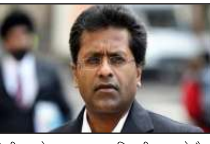
सामान्य नागरिक ही बता रहे हैं। इस संबंध में ललित मोदी ने राम नवमी के दिन लगातार कई ट्विट कर कांग्रेस और राहुल गांधी पर निशाना साधा है। उन्होंने कहा कि मैं भगौड़ा हूँ इसका क्या सबूत है,

आईपीएल के संस्थापक रहे ललित मोदी ने राहुल गांधी पर जमकर हमला बोला है। ललित मोदी ने ट्वीट कर राहुल गांधी को कोर्ट में घसीटने की धमकी तक दे डाली है। ललित मोदी ने ब्रिटेन की अदालत में राहुल गांधी के खिलाफ मामला दर्ज करने की धमकी दी है। ललित मोदी ने राहुल गांधी के बयानों पर पलटवार किया है। उन्होंने मोदी सरनेम विवाद में सांसद सीट गंवाने वाले नेता द्वारा भगौड़ा कहे जाने पर आपत्ति जताई है। बता दें कि राहुल गांधी ने वर्ष 2019 में कर्नाटक के कोलार में एक आयोजित की गई चुनावी रैली के दौरान कहा था कि, सभी चोरों का एक ही सरनेम है मोदी। इस मामले पर राहुल गांधी की संसद सदस्यता जा चुकी है। वहीं अब ललित मोदी ने भी उनके खिलाफ सख्त कदम उठाने की धमकी दी है। गौरतलब है कि मनी लॉन्ड्रिंग मामले में ललित मोदी को भगौड़ा घोषित किया गया है। इसके बाद भी ललित मोदी खुद को सामान्य नागरिक ही बता रहे हैं। इस संबंध में ललित मोदी ने राम नवमी के दिन लगातार कई ट्विट कर कांग्रेस और राहुल गांधी पर निशाना साधा है। उन्होंने कहा कि मैं भगौड़ा हूँ इसका क्या सबूत है, किस आधार पर भगौड़ा बुलाया जा रहा है। उन्होंने कहा कि मुझे कभी दोषी नहीं ठहराया गया है, इसलिए वो एक सामान्य नागरिक है। उन्होंने कहा कि विपक्ष के नेता सिर्फ बदले की राजनीति कर रहे हैं। ललित मोदी ने कहा कि मैंने राहुल गांधी को तत्काल ही यूकी की अदालत में घसीटने का फैसला किया है। उन्हें अपने लिए ठोस सबूत इकट्ठे करने चाहिए और उनके साथ ही यहां आए। ललित मोदी सिर्फ राहुल गांधी पर हमला कर ही चुप नहीं हुआ। उन्होंने