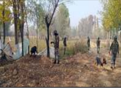
जम्मू-कश्मीर के कठुआ जिले में भारत-पाकिस्तान सीमा के पास हीरानगर में ये धमाका हुआ है। ब्लास्ट के बाद इलाके में सर्च ऑपरेशन चलाया जा रहा है। वहीं जानकारी सामने आई है कि ब्लास्ट इतना शक्तिशाली था कि विस्फोट करीब साढ़े नौ बजे विस्फोट की