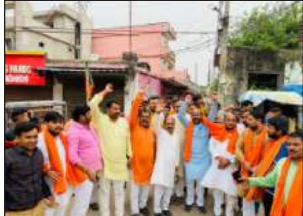
दैनिक बुद्ध का संदेश बस्ती। नगर पालिका चुनाव में मतदान जितना