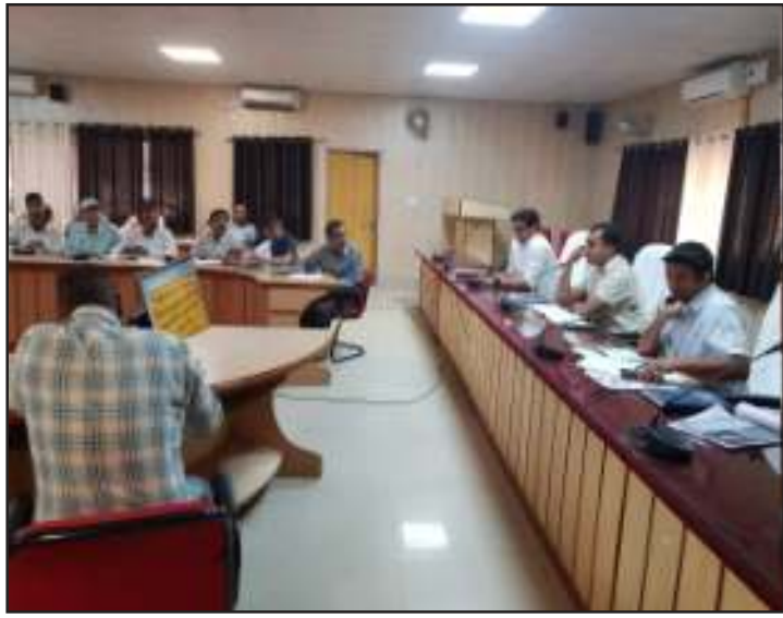
नगर निकाय अधिकारियों को सौंपे गए कार्यों की समीक्षा की। प्रभारी अधिकारी मतपत्र जिला कृषि अधिकारी ने बताया कि जनपद में 4 मई के मतदान को कराने के लिए मतपत्र आ

दैनिक बुद्ध का संदेश बलरामपुर। नगर निकाय चुनाव को सफुशल, निष्पक्ष रूप से संपन्न कराने हेतु जिला निर्वाचन अधिकारी जिलाधिकारी डॉ महेन्द्र कुमार की अध्यक्षता में कलेक्ट्रेट सभागार में बैठक संपन्न हुई। बैठक में नगर निकायों के अध्यक्ष पद एवं सदस्य पद के निर्वाचन अधिकारी एवं निर्वाचन कार्यों के प्रभारी अधिकारी उपस्थित रहे। बैठक में डीएम ने प्रभारी अधिकारियों को सौंपे गए कार्यों की समीक्षा की। प्रभारी अधिकारी मतपत्र जिला कृषि अधिकारी ने बताया कि जनपद में 4 मई के मतदान को कराने के लिए मतपत्र आ