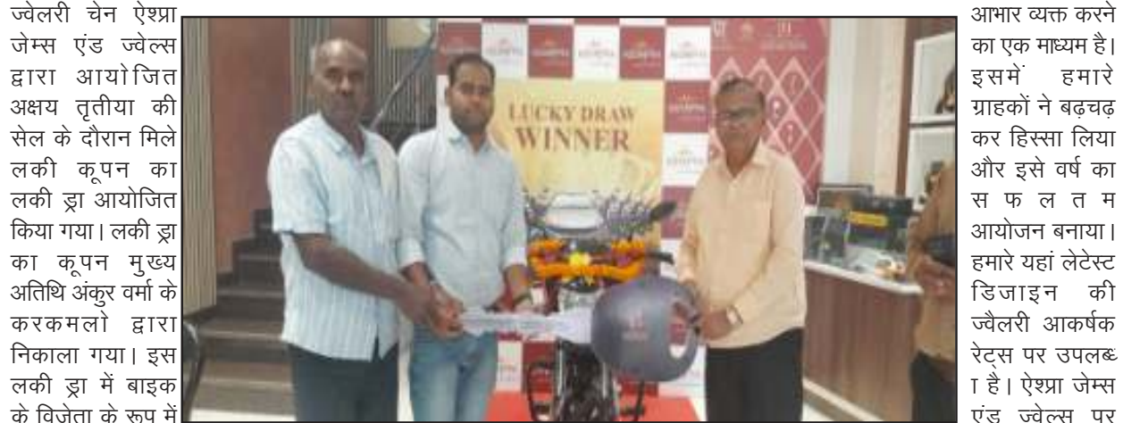
लकी ड्रा सेल का आयोजन अक्षय तृतीया के अवसर पर 2 से 21 अप्रैल 2023 के बीच किया गया था। इस दौरान हर 25 हजार रुपये की खरीदारी करने पर ग्राहकों को एक लकी ड्रा कूपन दिया गया था। राज्य के अलग अलग जिलों में स्थित शोरूम पर आयोजित इस लकी

सेल में खरीदारी करने वाले सभी बस्तीवासियों का इसे सफल किया गया था। लकी ड्रा जैसे आयोजन हमारे ग्राहकों के प्रति आभार व्यक्त करने का एक माध्यम है। इसमें हमारे ग्राहकों ने बढ़चढ़ कर हिस्सा लिया और इसे वर्ष का सफलतम आयोजन बनाया। हमारे यहां लेटेस्ट डिजाइन की ज्वेलरी आकर्षक रेट्स पर उपलब्ध है। ऐश्रा जेम्स एंड ज्वेल्स पर