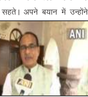
सहते। अपने बयान में उन्होंने कहा कि आखिर कांग्रेस में कितना अपमान सहते। उन्होंने साफ तौर पर कहा कि चुनाव लड़ा ज्योतिरादित्य सिंधिया के नाम पर और बुजुर्ग कमलनाथ जी को मुख्यमंत्री बना दिया। शिवराज ने अपना हमला जारी रखते हुए कहा कि सरकार भी कमलनाथ

भोपाल। मध्यप्रदेश में वार-पलटवार का दौर लगातार जारी है। मध्यप्रदेश में इस साल विधानसभा के चुनाव होने हैं। चुनावी साल में राजनीति भी जबरदस्त तरीके से हो रही है। दूसरी ओर कांग्रेस लगातार यह दावा कर रही है कि ज्योतिरादित्य सिंधिया की वजह से भाजपा सत्ता में आई। इसी को लेकर अब मध्य प्रदेश के मुख्यमंत्री शिवराज सिंह चौहान ने कांग्रेस पर पलटवार किया है। शिवराज ने साफ तौर पर कह दिया कि ज्योतिरादित्य सिंधिया कांग्रेस में रहते तो कितना अपमान