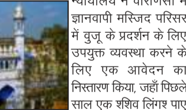
जाने का दावा किया गया था। मुख्य न्यायाधीश डीवाई चंद्रचूड़ और पीएस नरसिम्हा की पीठ ने भारत के लिए सॉलिसिटर जनरल तुषार मेहता द्वारा प्रदान किए गए आश्वासन को दर्ज करने के बाद ही आवेदन का निस्तारण किया। ईद के मौके पर मस्जिद जिला प्रशासन द्वारा उस स्थान पर पर्याप्त पानी उपलब्ध कराया जाएगा जहाँ वजू किया जाता है। पीठ ने कहा कि हम भारत के लिए सॉलिसिटर-जनरल का बयान दर्ज करते हैं कि वजू के प्रदर्शन को सुविधाजनक बनाने के लिए, कलेक्टर या जिला मजिस्ट्रेट यह सुनिश्चित करेंगे कि पर्याप्त संख्या में टब हों और पानी के लिए सुविधाएं निकटता में उपलब्ध हों ताकि जो नमाज अदा करने आए उन्हें असुविधा न हो।

वाराणसी। ईद-उल-फितर से पहले भारत के सर्वोच्च न्यायालय ने वाराणसी में ज्ञानवापी मस्जिद परिसर में वजू के प्रदर्शन के लिए उपयुक्त व्यवस्था करने के लिए एक आवेदन का निस्तारण किया, जहाँ पिछले साल एक शिव लिंग पर पीएस नरसिम्हा की पीठ ने भारत के लिए सॉलिसिटर जनरल तुषार मेहता द्वारा प्रदान किए गए आश्वासन को दर्ज करने के बाद ही आवेदन का निस्तारण किया। ईद के मौके पर मस्जिद जिला प्रशासन द्वारा उस स्थान पर पर्याप्त पानी उपलब्ध कराया जाएगा जहाँ वजू किया जाता है। पीठ ने कहा कि हम भारत के लिए सॉलिसिटर-जनरल का बयान दर्ज करते हैं कि वजू के प्रदर्शन को सुविधाजनक बनाने के लिए, कलेक्टर या जिला मजिस्ट्रेट यह सुनिश्चित करेंगे कि पर्याप्त संख्या में टब हों और पानी के लिए सुविधाएं निकटता में उपलब्ध हों ताकि जो नमाज अदा करने आए उन्हें असुविधा न हो।