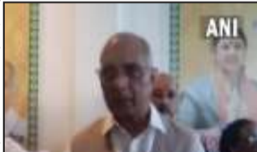
अहमद की हत्या कराने का काम विपक्ष ने किया है। इसके साथ ही उन्होंने यह भी दावा किया कि कुछ गंभीर राज खुलने वाले थे इसलिए विपक्ष ने उसकी हत्या करा दी। गैंगस्टर से नेता बने माफिया व समाजवादी पार्टी के

लखनऊ। प्रयागराज में अतीक अहमद और उसके भाई अशरफ कि शनिवार रात गोली मारकर हत्या कर दी गई थी। इसके बाद से उत्तर प्रदेश में राजनीतिक जबरदस्त तरीके से जारी है। विपक्ष उत्तर प्रदेश की योगी सरकार पर निशाना साधा है और साफ तौर पर कह रहा है कि उत्तर प्रदेश में जंगलराज है। वहीं, इसी मुद्दे को लेकर अब उत्तर प्रदेश के मंत्री धर्मपाल सिंह का बड़ा बयान आया है। उन्होंने साफ तौर पर