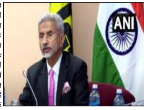
अनुसरण का स्वागत करते हैं। इस समय हम वैश्विक समस्याओं और खुद से संबंधित समस्याओं के समाधान के लिए काम कर रहे हैं। जयशंकर ने गुयाना की राजधानी जॉर्जटाउन में जमैका की अपनी समकक्ष कैमिनाज सिमथ

नई दिल्ली। गयाना में चौथी कैरिफॉम-भारत मंत्रिस्तरीय बैठक में अपनी प्रारंभिक टिप्पणी के दौरान विदेश मंत्री एस जयशंकर ने कहा कि नवीकरणीय ऊर्जा हमारा सामूहिक प्रयास है... कैपेसिटी बिल्डिंग में हम उन क्षेत्रों में कार्यक्रमों को अनुकूलित करने के लिए तैयार हैं जो कैरिफॉम यूजर के लिए समर्पित हैं। डब्ल्यूएचओ ने पहले ट्रेडिशनल मेडिसिन सेंटर के भारत में निर्माण की स्वीकृति दी है। यहां हम दुनिया के हर