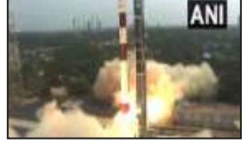
श्रीहरिकोटा से सिंगापुर के 2 सैटेलाइट लॉन्च नई दिल्ली। भारतीय अंतरिक्ष अनुसंधान संगठन (इसरो) ने शनिवार को दो ग्राहक उपग्रह अंतरिक्ष में प्रक्षेपित किए। सिंगापुर के उपग्रहों को भारतीय अंतरिक्ष एजेंसी, न्यू स्पेस इंडिया लिमिटेड (छेप्) की वाणिज्यिक शाखा के साथ एक अनुबंध के तहत लॉन्च किया गया है। श्रीहरिकोटा से सिंगापुर की 2 सैटेलाइट इसरो ने लॉन्च की है। ये सैटेलाइट राष्ट्रीय सुरक्षा और मौसम की जानकारी देंगे। ये पीएसएलवी की 57वीं उड़ान है। इस मिशन को टीएलईओएस-2 मिशन का नाम दिया गया। इस लॉन्चिंग के साथ ही ऑर्बिट में भेजे गए विदेशी सैटेलाइट की कुल संख्या 424 हो गई। पोलर सैटेलाइट लॉन्च व्हीकल (छेप्ट) ने श्रीहरिकोटा के सतीश धवन अंतरिक्ष केंद्र से दोपहर 2:49 बजे 741 किलो वजन की सैटेलाइट ज्स्ट-2 और 16 किलो वजन वाले लुमिलाइट-4 सैटेलाइट के साथ उड़ान भरी। इन दोनों सैटेलाइट के अलावा सात अन्य पेलोड भी हैं, जो रॉकेट के लास्ट स्टेप चै 4 का हिस्सा हैं।

लोमों ने अपनी खुशी का इजहार किया और बताया कि हमने घाटी में शांति और समृद्धि के लिए प्रार्थना की। हम आपको यह भी बता दें कि श्रीनगर की ऐतिहासिक जामिया मस्जिद समेत पूरे कश्मीर में रमजान के आखिरी शुक्रवार को मजहबी खुलूस के साथ 'जुमा-तुल-विदा' की नमाज भी शांतिपूर्ण ढंग से अदा की गई थी। इस दौरान सबसे अधिक नमाजी पुराने शहर में स्थित जामिया मस्जिद में एकत्र हुए, जहां तीन साल बाद अलविदा जुमे की नमाज अदा की गई। हम आपको यह भी बता दें कि इसके अलावा इस बार कश्मीर घाटी में रहमतों की रात माने जाने वाले 'शब-ए-कदर' पर भी लोगों को ऐतिहासिक जामा मस्जिद में भी सामूहिक प्रार्थना की इजाजत दी गई थी। 2019 के बाद यह पहला मौका था, जब 14वीं शताब्दी में बनी इस मस्जिद में शब-ए-कदर इबादत की इजाजत दी गई थी।