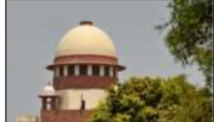
याचिका में की गई प्रार्थनाओं में से एक का भी उल्लेख किया, जिसमें कहा गया था कि सावरकर के साथ हुए अन्याय का आंशिक प्रायश्चित्त रने के लिए केंद्र को एक अधिकार प्राप्त समिति बनाने का निर्देश दिया जा सकता है। 1944 में सावरकर द्वारा परिकल्पित स्नातकोत्तर अध्ययन करने के लिए मेधावी छात्रों को विदेशी छात्रवृत्ति देने के लिए प्रतिष्ठित