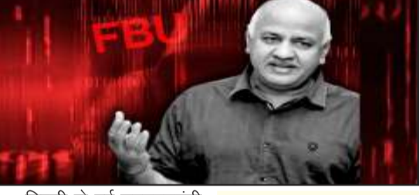
दिल्ली के पूर्व उपमुख्यमंत्री मनीष सिसोदिया की मुश्किलें कम होने का नाम नहीं ले रही है। पहले तो सीबीआई की गिरफ्त में आए सीबीआई को ईडी ने भी झटका देते हुए अपने रिमांड में ले लिया। अब सीबीआई की तरफ से मनीष सिसोदिया की परेशानी और बढ़ सकती है। सीबीआई ने शफीबकैक यूनिट मामले में मनीष सिसोदिया के खिलाफ मामला दर्ज किया है। दिल्ली सरकार की शफीबकैक यूनिट में कथित अनियमितताओं को लेकर केंद्रीय जांच ब्यूरो ने गुरुवार को दिल्ली के पूर्व उपमुख्यमंत्री मनीष सिसोदिया के खिलाफ एक नया मामला दर्ज किया। गृह मंत्रालय ने दिल्ली के उपमुख्यमंत्री मनीष सिसोदिया पर फीडबैक यूनिट (एफबीयू) जासूसी मामले में भ्रष्टाचार निरोधक कानून के तहत मुकदमा चलाने की मंजूरी दे दी थी। सीबीआई ने अपनी प्रारंभिक जांच के बाद कहा था कि एफबीयू का इस्तेमाल ध्वंसकारी विभागों, स्वायत्त निकायों, संस्थानों और अन्य संस्थाओं पर नजर रखना था। फीडबैक यूनिट बनाने का निर्णय 29 सितंबर, 2015 को मुख्यमंत्री अरविंद केजरीवाल की अध्यक्षता में दिल्ली सरकार की कैबिनेट बैठक में लिया गया था।