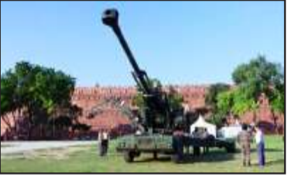
हेलीकाप्टर आदि खरीदने के लिए रक्षा मंत्रालय ने 70.51 हजार करोड़ रुपये के प्रस्तावों को मंजूरी दी है। रक्षा क्षेत्र में शमेक इन इंडियाएर के तहत यह बहुत बड़ा कदम है। भारतीय रक्षा बलों के लिए इससे विभिन्न शस्त्र प्रणालियां खरीदी जाएगी।

नई दिल्ली। हॉवित्जर, 70,584 करोड़ रुपये की रक्षा ब्राह्मिस मिसाइलें, यूएच मेरीटाइम खरीद प्रस्तावों को मंजूरी: अधि कारियों ने बताया कि 70,584 करोड़ रुपये की रक्षा खरीद प्रस्तावों को मंजूरी गुरुवार को रक्षा मंत्री राजनाथ सिंह की अध्यक्षता में रक्षा अधिग्रहण परिषद (डीएसी) ने दी। सभी खरीद (भारतीय-स्वदेशी रूप से डिजाइन, विकसित और निर्मित) श्रेणी के तहत की जाएगी। चीन के साथ पूर्वी लड़ाख में शमेक इन इंडियाएर के तहत यह बहुत बड़ा कदम है। भारतीय रक्षा बलों के लिए इससे विभिन्न शस्त्र प्रणालियां खरीदी जाएगी।