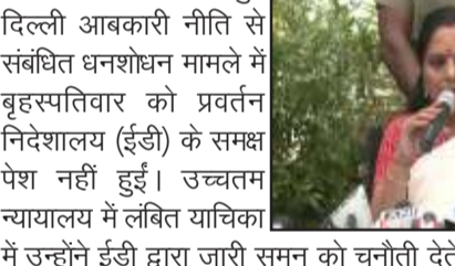
कविता ने कहा कि चूंकि समन में यह नहीं कहा गया है कि उन्हें व्यक्तिगत रूप से पेश होने की जरूरत है, इसलिए वह अपने अधिकृत प्रतिनिधि को भेज रही हैं। उन्होंने लिखा, मैं विनम्रतापूर्वक आपसे विनती करती हूँ कि उच्चतम न्यायालय के समक्ष कार्यवाही लंबित है, इसलिए समन के बारे में कोई भी कार्यवाई करने से पहले उसके निर्देश का इंतजार किया जाना चाहिए।

नयी दिल्ली। भारत राष्ट्र समिति (बीआरएस) उच्चतम न्यायालय ने बुधवार को इस मामले में ईडी की नेता के. कविता उच्चतम न्यायालय में लंबित के समन को चुनौती देने और गिरफ्तारी से संरक्षण याचिका का हवाला देते हुए दिल्ली आबकारी नीति से संबंधित धनशोधन मामले में बृहस्पतिवार को प्रवर्तन निदेशालय (ईडी) के समक्ष पेश नहीं हुई। उच्चतम न्यायालय में लंबित याचिका में उन्होंने ईडी द्वारा जारी समन को चुनौती देते हुए गिरफ्तारी से संरक्षण का अनुरोध किया है। तेलंगाना विधान परिषद की सदस्य तथा राज्य के मुख्यमंत्री के. चंद्रशेखर राव की बेटी कविता ने अपना अधिकृत प्रतिनिधि (बीआरएस का एक पदाधिकारी) भेजा, जिन्होंने मामले के जांच अधिकारी को उनके लेनदेन के बारे में छह पृष्ठ का प्रतिवेदन, बैंक स्टेटमेंट, व्यक्तिगत व व्यावसायिक विवरण प्रदान किया।