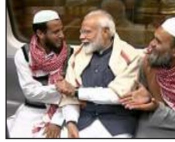
समुदाय के 5000 श्रमोदी मित्र बनाने की योजना है। मोदी मित्र का काम अपने-अपने जिलों में मुसलमान मतदाताओं को पार्टी से जोड़ने का रहेगा। इनमें सबसे ज्यादा उत्तर प्रदेश और पश्चिम बंगाल के जिलों को शामिल किया गया है। इन दोनों ही राज्यों के 13-13 जिले शामिल

होंगे। इसके अलावा बिहार, असम और केरल के मुस्लिम बहुल जिलों को इसमें शामिल किया गया है। जानकारी के मुताबिक यह योजना 25 अप्रैल से शुरू होगी। इसके साथ ही मुस्लिमों का साथ लेकर जनसंपर्क अभियान भी शुरू हो रहा है जिससे की पार्टी को आगामी चुनाव में मुसलमानों का साथ मिल सके। इस तरह के अभियान का मकसद मुस्लिमों के घर-घर में जाकर मोदी सरकार की नीतियों योजनाओं और कार्यों से लोगों को अवगत कराना है। इसके अलावा पार्टी सूत्रों ने बताया कि भाजपा के अल्पसंख्यक मोर्चा ने अगले साल होने वाले लोकसभा चुनाव को ध्यान में रखते हुए रसूफी संवाद महा अभियान नामक एक मुस्लिम आउटरीच कार्यक्रम शुरू किया है। इस अभियान को सफल बनाने के लिए भाजपा ने देश भर में इस मेगा आउटरीच प्रयास को करने के लिए 150 गैर-राजनीतिक लोगों की एक टीम को एक साथ रखा है। इन लोगों को अलग-अलग टीमों में विभाजित किया जाएगा। यह टीम अल्पसंख्यकों में मोदी सरकार के कामों को बताएगी और उन्हें पार्टी से भी जोड़ेगी। नरेंद्र मोदी के नेतृत्व वाली भाजपा सरकार द्वारा अल्पसंख्यकों को उनके लिए किए गए कार्यों से अवगत कराने के लिए टीमों कई मुस्लिम बहुल लोकसभा क्षेत्रों का दौरा करेगी।