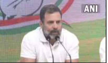
राहुल गांधी ने साफ तौर पर कहा कि सरकार और प्रधानमंत्री नरेंद्र मोदी अडानी मुद्दे को लेकर डरे हुए हैं। इसलिए ध्यान भटकाने के लिए यह मुद्दा उठाया जा रहा है। इसलिए मुझे लगता है कि वह संसद में मुझे बोलने नहीं देंगे। राहुल गांधी ने कहा कि प्रधानमंत्री और अडानी के बीच की रिश्ता क्या है? रक्षा सौदे

फिलहाल, सिसोदिया न्यायिक हिरासत में तिहाड़ जेल में बंद है। उन्हें ईडी ने भी गिरफ्तार किया है। दूसरी ओर तेलंगाना के मुख्यमंत्री के सियार की बेटी की कविता से भी पूछताछ हो रही है। वहीं जमीन के बदले नौकरी मामले में लालू यादव और उनके परिवार भी लगातार जांच एजेंसियों के रडार पर है। वहीं, आज जम्मू-कश्मीर की पूर्व मुख्यमंत्री महबूबा मुफ्ती ने पुंछ जिले के अपने दौरे के दौरान नवग्रह मंदिर में पूजा-अर्चना की। उन्होंने पूरे मंदिर का चक्कर लगाया और शिवलिंग का जलाभिषेक भी किया। उन्होंने मंदिर परिसर में बनी यशपाल शर्मा की प्रतिमा पर पुष्पघर्षा भी की। महबूबा मुफ्ती की मंदिर यात्रा बीजेपी की जम्मू-कश्मीर विंग को अच्छी नहीं लगी, जिसने उनकी मंदिर यात्रा को राजनीतिक नौटंकी बताया।