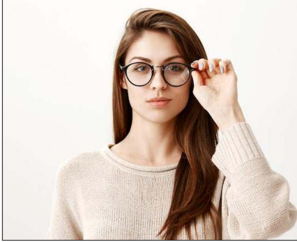
सन स्विंगिंग: सूरज की ओर आंख कर उसे बंद दूसरी साइड तक स्विंग कीजिए। पांच मिनट तक

गुलाब जल: गुलाब जल आंखों को ठंडक देने का कार्य करता है और इसको आंखों में डालने से आंखों की रोशनी बनी रहती है और कम भी नहीं होती है। इसलिए अगर आपको चश्मा चढ़ा हुआ है तो आप हफ्ते में दो बार गुलाब जल इनमें जरूर डालें। हालांकि गुलाब जल आंखों में डालने से पहले ये सुनिश्चित कर लें, कि ये आपकी आंखों को सूट करता हो और जो जल आप डाल रहे हैं वो सही क्वालिटी का हो।