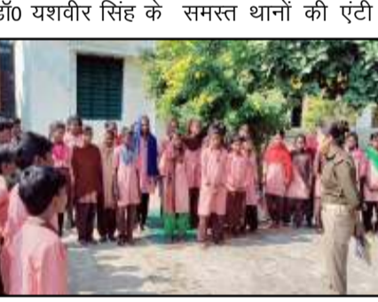
निर्देशन में जनपदीय पुलिस के

दैनिक बुद्ध का संदेश सोनभद्र।शासन की मंशा के अनुरूप महिलाओं ६ बेटियों को स्वावलंबी और सुरक्षित बनाने तथा उनके अधिकारों के सम्बंध में जागरूक करने व उनके साथ घटित होने वाले अपराधों पर प्रभावी रोकथाम करते हुए उनमें सुरक्षाआत्मविश्वास की भावना जागृत करने के उद्देश्य से 'मिशन शक्ति' अभियान के तहत पुलिस