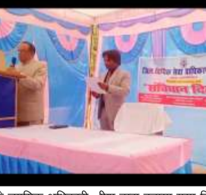
न्यायालय के न्यायिक अधिकारी गण अधिवक्ताओं, मीडिएटर्स परा विधिक स्वयं सेवकों न्यायालय के कर्मचारियों एवं उपस्थित पुलिसकर्मियों को कराया गया।

उक्त संविधान दिवस पर संविधान के मुल्यों एवं सिद्धांतों का उल्लेख करते हुए संविधान के आदर्शों को बनाए रखने हेतु हमारी प्रतिबद्धता एवं संविधान की प्रस्तावना का पाठन जनपद न्यायाधीश अध्यक्ष जिला विधिक