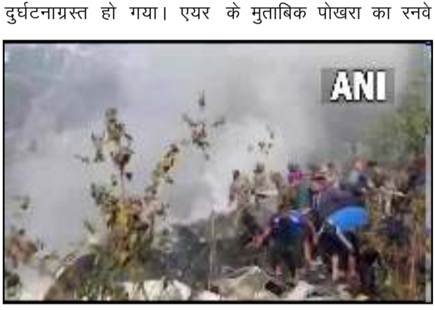
ट्रैफिक कंट्रोल (एटीसी) के स्टाफ पूर्व-पश्चिम दिशा में बना है।

पोखरा। नेपाल के पोखरा हवाईअड्डे के पास 72 लोगों को लेकर जा रहा यात्री विमान एटीआर-72 दुर्घटनाग्रस्त हो गया। विमान काठमांडू से पोखरा जा रहा था। यति एयरलाइंस के विमान में 68 यात्री और चालक दल के चार सदस्य सवार थे। बचाव कार्य जारी है और हवाईअड्डे को फिलहाल के लिए बंद कर दिया गया है। येती एयरलाइंस की फ्लाइट में 5 भारतीय सवार थे: यात्री विमान कथित तौर पर उतरने से सिर्फ दस सेकंड पहले