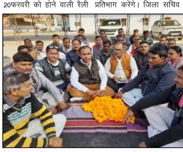
ऐतिहासिक रहेगी। उस सम्मान के यशस्वी मुख्यमंत्री के द्वारा ही अपने बाल बच्चों के साथ शिक्षामित्रों का सम्मान वापस