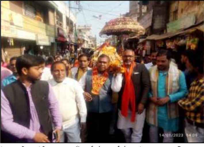
जी व नंदी भगवान, माँ दुर्गा के साई सेवा संस्थान द्वारा शनिवार