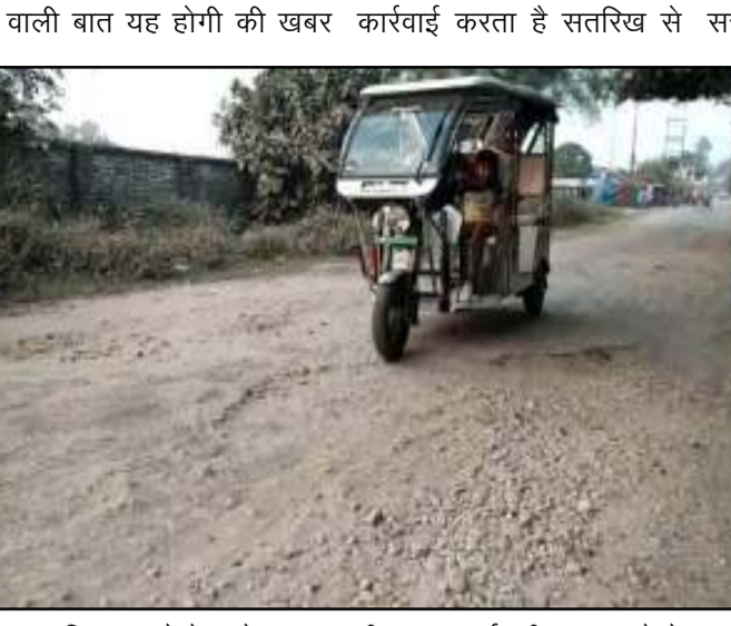
वर्कवाई करता है सतरिख से सरकार गड्डा मुक्त अभियान को 15 नवंबर तक पूरा करना था इसे लेकर शासन ने विभागीय आंकड़ों के हिसाब से 84: सड़कों की मरम्मत का दावा करते हुए 15 दिन का समय और मांगा है लेकिन विभागीय दावों के विपरीत बाराबंकी जिले में 50: सड़कों के भी गड्डे नहीं भरें कई प्रमुख सड़कें आज भी जर्जर हालत में हैं सड़कों की दशा ऐसी है कि उन पर पैदल चलना भी मुश्किल है। सतरिख बाराबंकी सतरिख से तीरगांव होते हुए सुल्तानपुर पूर्वांचल एक्सप्रेसवे को जोड़ने वाला सतरिख तीरगांव

पूरी तरह जर्जर पड़ा है जर्जर मार्ग पर दर्जनों गांव जोड़ने वाली मार्ग की दशा अभी तक नहीं सुधरी आपको बताते चलें सतरिख से तीरगांव के बीच स्कूली बच्चों को आने जाने में गड्डों से जंग लड़ना पड़ता है जिससे आए दिन होती है दुर्घटनाएं गड्डे बचाने के चक्कर में आए दिन हजारों की तादाद में स्कूली बच्चों का इसी रोड से आवागमन होता है सरकार दावा करती है कि विभागीय आंकड़ों के हिसाब से 84 परसेंट तक सड़कें दुरुस्त हो गईं लेकिन हकीकत तो यह है की अभी तक 50 परसेंट सड़कें भी दुरुस्त नहीं हुईं जिसकी हालत आप खुद इस वीडियो एवं फोटो