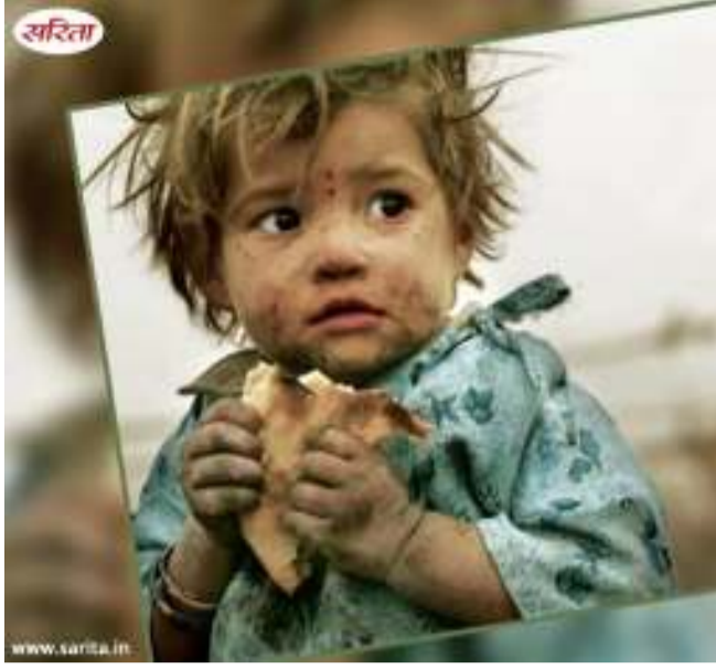
10 लाख नौकरी देने की बात कर रहे हैं और एक ही राज्य में साढ़े 37 लाख लोग नौकरी के लिए जगान दांव पर लगा रहे हैं!

पिछले दिनों दुनिया की दो जानी मानी संस्थाओं की ओर से तैयार किया जाने वाला ग्लोबल हंगर इंडेक्स जारी हुआ। मलब देशों में भूख का वैश्विक सूचकांक। इसमें भारत छह स्थान और गिर कर 107वें स्थान पर पहुंच गया है। वह पिछले साल 101वें स्थान पर था। उससे पहले के साल 94वें स्थान पर था। यानी मुफ्त अनाज बांटने की योजना जैसे जैसे आगे बढ़ी है वैसे वैसे भारत में भूख और कुपोषण बढ़ता गया है। कुछ समय पहले ही भारत शगरीबी की राजधानी बन गया। भारत ने नाइजीरिया को हटा कर उसकी जगह ली। अब भारत कुपोषण की राजधानी भी घोषित है। दुनिया में सबसे ज्यादा कुपोषित लोग खास कर बच्चे भारत में रहते हैं। जिन बच्चों की लंबाई उम्र के मुताबिक नहीं है या लंबाई के अनुपात में वजन कम है, ऐसे बच्चों में दुनिया के 19 फीसदी से ज्यादा भारत में हैं। दुनिया के भूखे लोगों में से 24 फीसदी का घर भारत है। यानी दुनिया का हर चौथा भूखा व्यक्ति भारतीय है। भूख लोगों की संख्या और उनकी स्थिति के मामले में पाकिस्तान, नेपाल, श्रीलंका, बांग्लादेश आदि सारे देश भारत से अब बेहतर स्थिति में हैं। सबकी रैंकिंग भारत से अच्छी है। मगर जिस दिन से यह रिपोर्ट आई है भारत सरकार इसे खारिज करने में लगी है। हकीकत मानने, उसमें सुधार करने की बजाय भारत सरकार हकीकत बताने वाले के पीछे पड़ी हुई है। बेरोजगारी के आंकड़े खुद संघ के दत्तात्रेय होसबाले ने बताए।