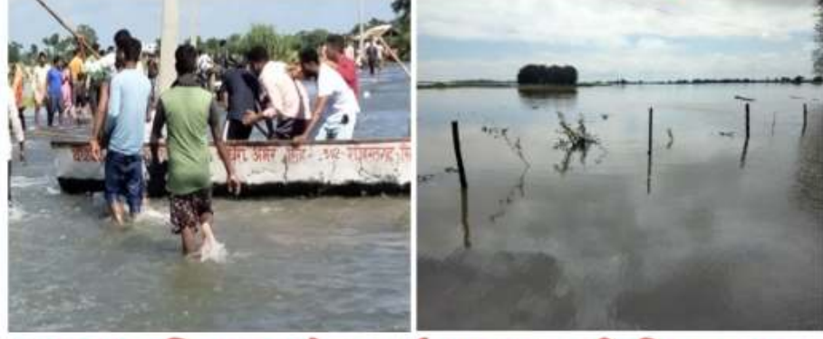
अवरुद्ध तुलसियापुर कठेला मार्ग धान व सब्जी की फसल डूबा