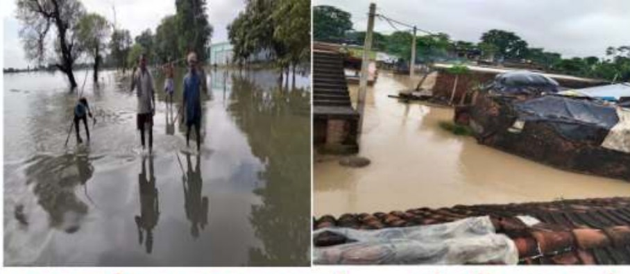
अवरुद्ध देबरुआ-इटवा मार्ग गांव में घुसा पानी

राजेश शर्मा / दैनिक बुद्ध का संदेश तुलसियापुर/सिद्धार्थनगर। जनपद इस समय बाढ़ को लेकर परेशान है खास कर डुमियागंज एंव भनावपुर,इटवा में बाढ़ अपना पैर बड़ी तेजी से पैर फैला रहा है जिसको लेकर जनपद में भय का माहौल बना हुआ, जनपद के सभी जनप्रतिनिधि इस समय जनता के बीच जा कर बचाव व राहत कार्य में जुट गये हैं पिछले कई दिनों से जिले में राप्ती,बूढ़ी राप्ती, कूड़ा, घोधी व बानगंगा नदियों के जलस्तर में बढ़ोतरी से बांधों पर खतरा मंडराने लगा है। कई स्थानों पर क्षतिग्रस्त बांधों के टूटने की आशंका से नदी एवं बांध किनारे बसे गांव के लोगों में त्रासदी का भय सताने लगा है। प्रशासन एवं सिंचाई विभाग सहित जनप्रतिनिधियों नेबाढ़ प्रभावित गांवों पर निगरानी बढ़ा दी है। जिले में राप्ती, बूढ़ी राप्ती, बानगंगा, कूड़ा और घोधी नदियों का जलस्तर बढ़ने से हाहाकार मच गया है। तुलसियापुर,कठेला, देबरुआ और इटवा की सड़कों पर पानी चढ़ने से आवागमन बाधित हो गया है। बाढ़ के पानी से हजारों एकड़ खेत में खड़ी फसल डूब गई है। कई गांव