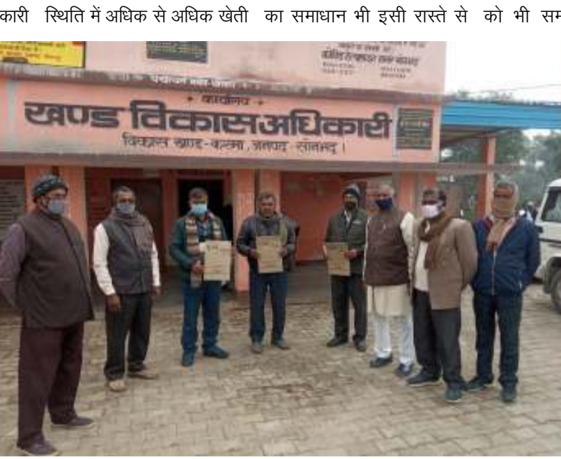
किसानों की ओर आकर्षित होंगे। निकल सकता है। भारत की छोटी-छोटी गांव सभाएं कर अंतिम दिन 11 जनवरी 2022

दैनिक बुद्ध का संदेश सोनभद्र। भारतीय किसान संघ का देशव्यापी आंदोलन के प्रथम एवं द्वितीय चरणों में ज्ञापन के विषयांतर्गत संदर्भित पत्रों की ध्यान आकर्षित करते हुए भारतीय किसान संघ अखिल भारतीय कार्यकारिणी एवं सभी प्रान्तों के अध्यक्षों मंत्रियों तथा संगठन मंत्रियों ने गहन मंथन के बाद तीन कृषि सुधार अध्यादेश में 5 संशोधन करने के पश्चात उन्हें लागू करने की मांग करते हुए काशी प्रान्त के पदाधिकारी, कार्यकर्ताओं ने राष्ट्र पति के नाम ज्ञापन करमा ब्लाक मुख्यालय पर खण्ड बिकास अधिकारी को दिए। ज्ञापन के माध्यम से निवेदन किया कि कानूनों में लाभकारी मूल्य का कोई जिक्र नहीं है। इसलिए चाहे चौथा