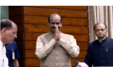
उन्होंने कहा, 'विकास के लिए शांति और स्थिरता आवश्यक है। इसलिए भारत लंबित मुद्दों को हल करने के लिए अन्य देशों के साथ नियमित तौर पर वार्ता करता है।' बिरला ने उम्मीद जताई कि दो दिवसीय बैठक के दौरान विचार-विमर्श से सदस्य देशों को अपने-अपने देशों में लोकतांत्रिक संस्थाओं को मजबूत करने में मदद

गुवाहाटी। लोकसभा अध्यक्ष ओम बिरला ने शनिवार को कहा कि भारतीय सांस्कृतिक लोकाचार दुनिया को एक वैश्विक परिवार के तौर पर देखता है और भारतीयों का मानना है कि सभी अंतरराष्ट्रीय विवादों का समाधान बातचीत के जरिए किया जाना चाहिए। उन्होंने कहा कि भारत शांति एवं स्थिरता सुनिश्चित करने के लिए लंबित