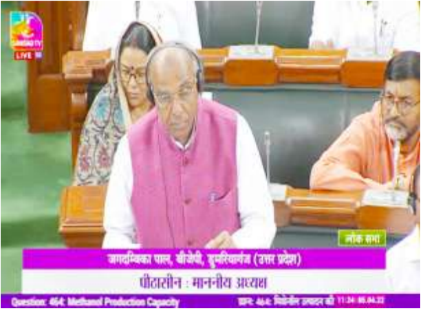
जगदम्बिका पाल, बीजेपी, बुद्धार्थनगर (उत्तर प्रदेश) प्रोत्साहन: माननीय प्रारंभ Question: 454. Methanol Production Capacity MP: 464. मिथेनॉल उत्पादन की क्षमता

मंत्रियों और सचिवों तथा ऑटो प्रायोगिक स्तर का 0.25 मीट्रिक